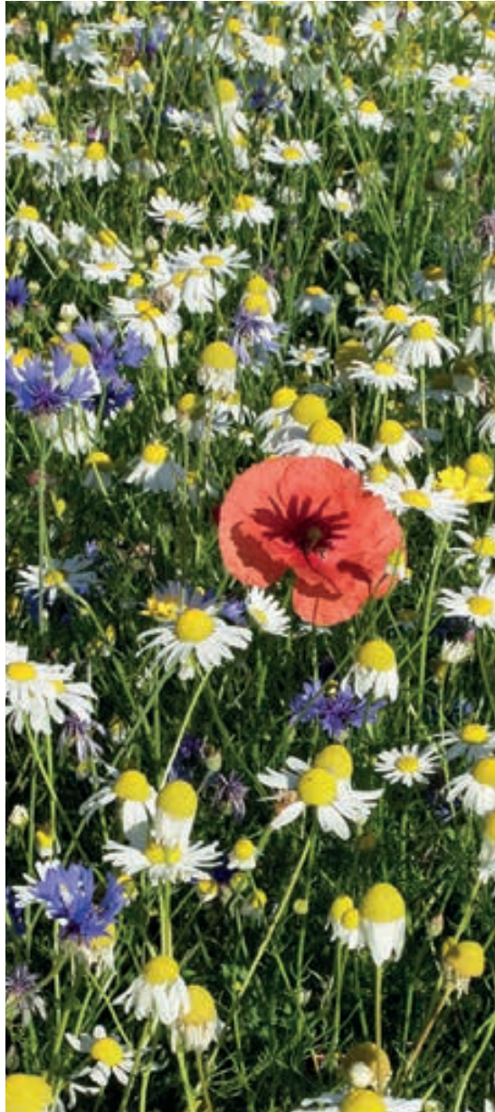
Die Mischung blüht bis weit in den Juli hinein reichlich