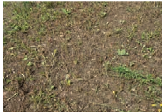
Ende September wird die Fläche gemäht oder gehäckselt