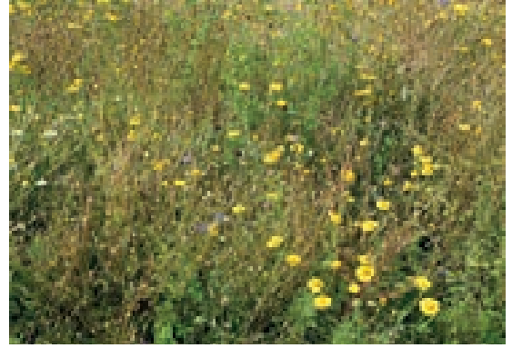
Ende Juli geht die Blühintensität zurück